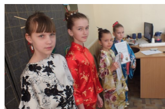
Мастер-класс «Секреты китайской чайной церемонии»

змеев, основой которых были бамбуковые палочки, мастерили лошадок из квиллинга. Я попала на мастер-класс по корейской кухне. «Кимпап» (корейские роллы) очень вкусные. Затем мастер-классы закончились, на все я, конечно же, не