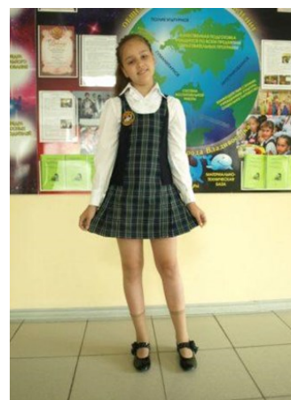
Гимназистка в школьной форме