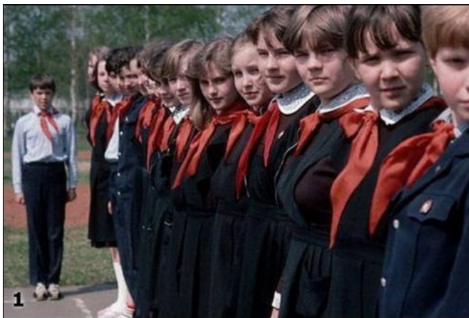
Пионеры в школьной форме

Что касается формы в нашей гимназии, она введена с 2006 года. Дети были не в восторге от такой новости и всячески сопротивлялись нововведению. Скажем честно, что в течение семи лет только единицы носили клетчатые юбки и сарафаны. Они терпели все: ссоры с учителями, с завучами, многочисленные приглашения родителей в школу и советы по профилактике — лишь бы не надевать на себя эти изделия из клетчатой ткани. И абсолютно каждого ученика гимназии возмущал тот факт, что большинство школ города не имеют школьной формы. «Чем же мы хуже?». С мальчиками дело обстояло проще. Тех, кто категориче-