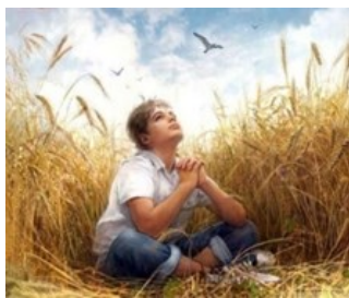
Иллюстрация к книге «Над пропастью во ржи», издательство Домино, Санкт-Петербург

«Есть преступления хуже, чем сжигать книги. Например – не читать их» – так сказал американский писатель-фантаст XX века Рэй Брэдбери. Мы полностью согласны с этим высказыванием, ведь чтение книг – это залог успеха и хорошего интеллектуального развития. Чтение расширяет словарный запас, кругозор и влияет на восприятие мира. Читающий человек – это всегда интересный собеседник и разносторонняя личность. Книги учат нас мыслить шире. И, помимо школьной литературы, школьнику необходимо читать другие произведения. С помощью рубрики «Читающая гимназия» вы сможете найти для себя хорошую книгу, которая не входит в курс школьной программы, но, возможно, именно она станет вашей любимой.